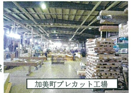
加美町プレカット工場