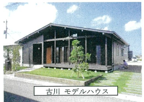
古川 モデルハウス

お申し込み方法：同行者全員の住所，氏名，年齢，性別，当日連絡できる連絡先を明記の上，下記まで「はがき」にてお申し込み下さい。締切後、結果及び詳細を皆様に連絡します。